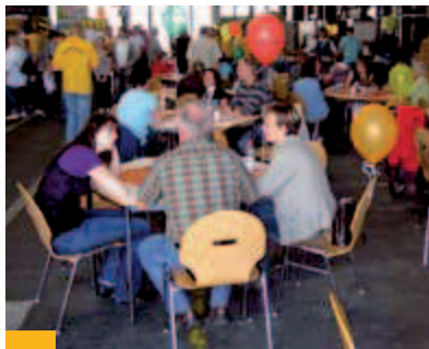
Beim Tag der offenen Ausbildung herrscht stets reges Treiben bei BUTTING

Ausbildungsdauer: 3 Jahre Berufsschule: BBS II Wolfsburg